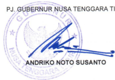
ANDRIKO NOTO SUSANTO